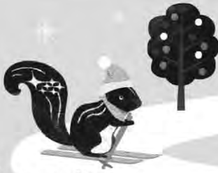
スバリス

「水辺の事故ゼロ」をめざす日本ライフセービング協会の活動に賛同し、アウトドアと親和性の高い「フォレスター」を「ライフセーバーカー」として貸与。県内の海岸パトロールをサポートしています。